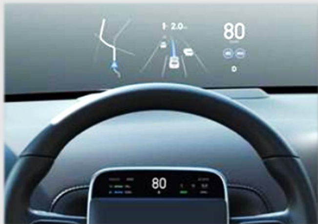
抬頭顯示/儀表顯示